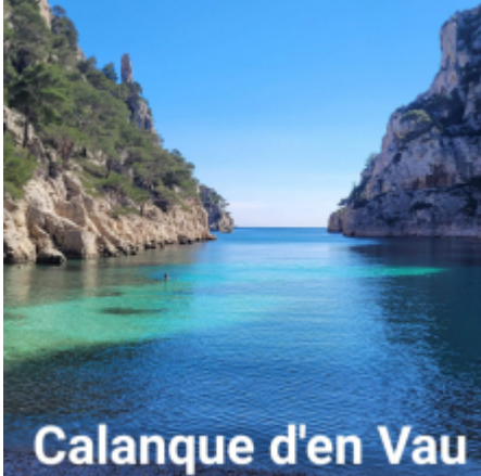
Calanque d'en Vau